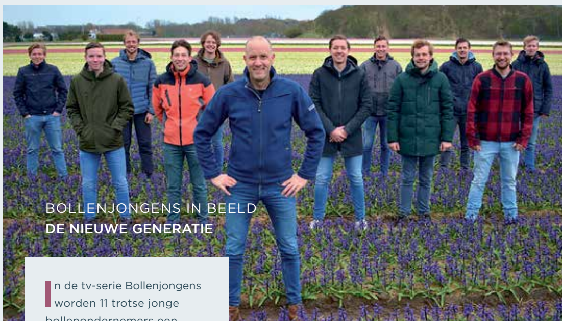
BOLLENJONGENS IN BEELD DE NIEUWE GENERATIE

Dit is een selectie van projectresultaten waar door bevolgen en betrokken projectleiders en -teams hard aan is gewerkt. Online presenteert EBDB een compleet eindverslag met alle projecten uit de verschillende businesscases van de Economische Agenda 2018-2021.